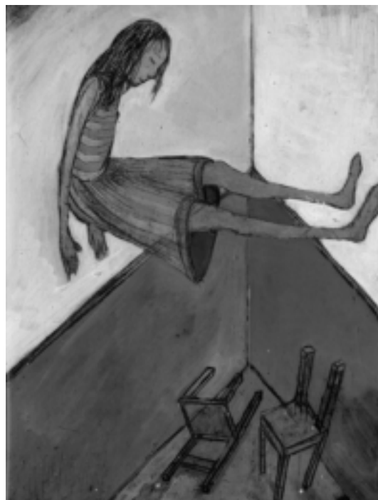
ILLUSTRATIONS DE NATALI FORTIER POUR SUR LA POINTE DES PIEDS (L'ATELIER DU POISSON SOLUBLE)

C'est une installation qui a pour thème «De l'autre côté du miroir». Je fais un jeu de croquet à bascule, sur une dizaine de cerceaux, j'accroche un torse avec à chaque bout une tête. Il y a la souriante d'un côté, la grimaçante de l'autre, le loup et le chapeau rouge, la jeune, la vieille, l'oiseau et l'enfant, Pinocchio avec et sans son long nez... Lorsqu'on les frappe avec le maillet, les sculptures tournent et basculent d'un visage à l'autre. J'écris aussi un livre, Masque , avec des visages et des têtes d'animaux que je fabrique depuis plus de dix ans. J'aime avoir plusieurs projets à la fois, ce sont mes points d'appui, comme un perroquet qui se déplace avec ses pattes, ses ailes et aussi son bec.