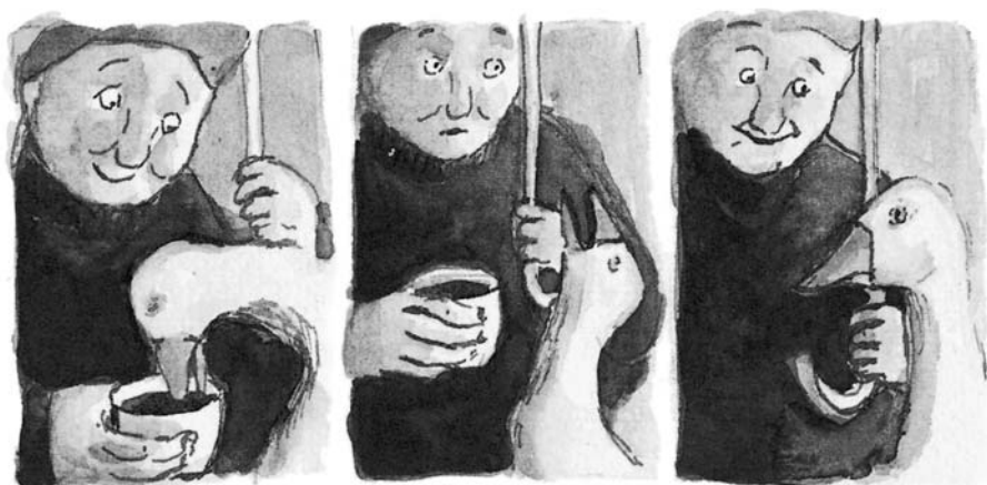
ILLUSTRATION D'ANNE BROUILLARD

le graphisme se fait stylisé. Ici, tout comme dans Le petit chaperon rouge de Rascal (Pastel) ou Rayon X de Helge Reumann (Le Rouergue), l'image même s'économise au profit d'un souhait, commun à tous ces albums : laisser les lecteurs s'approprier le livre et penser leur propre narration.