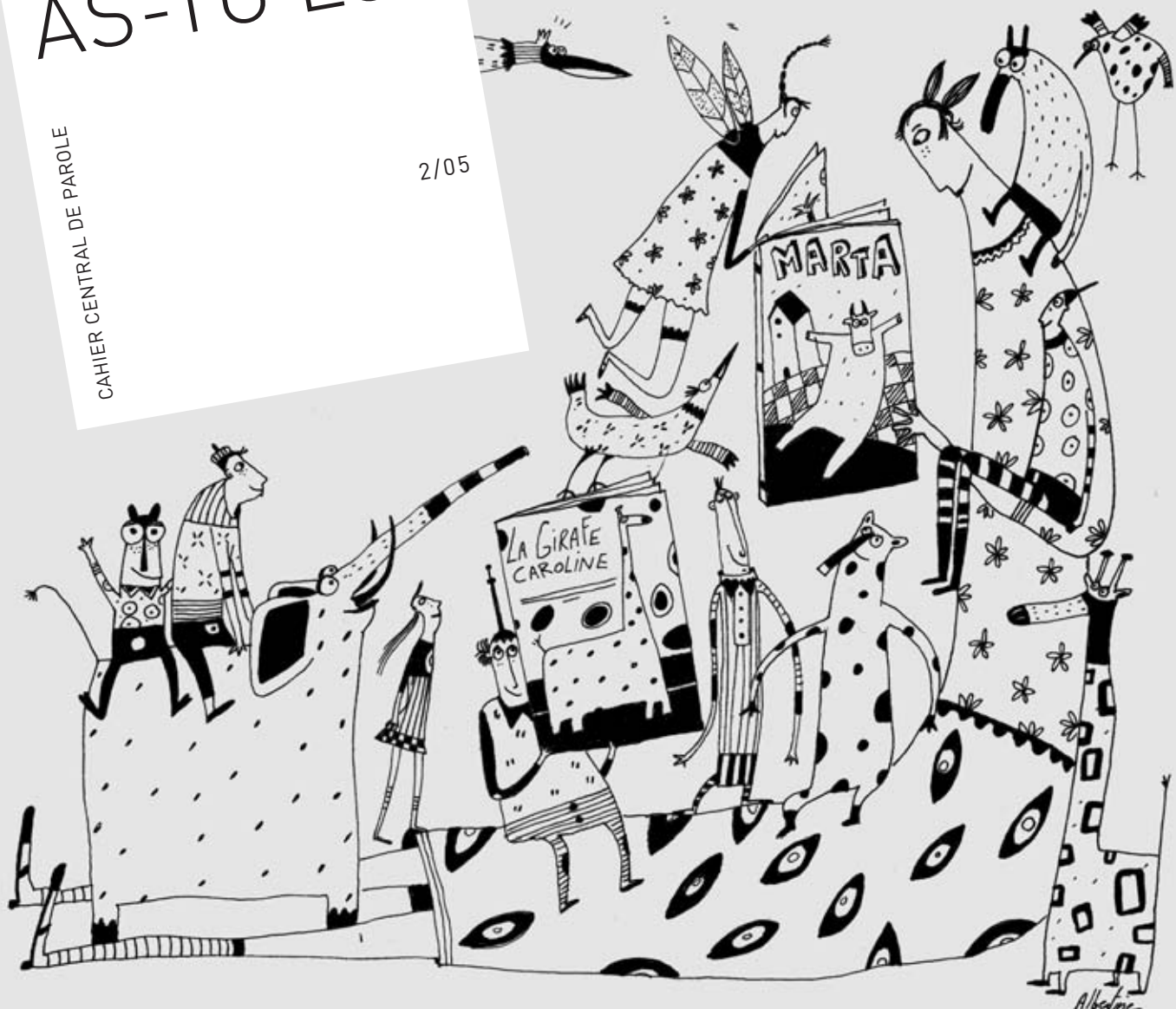
ILLUSTRATION : ALBERTINE