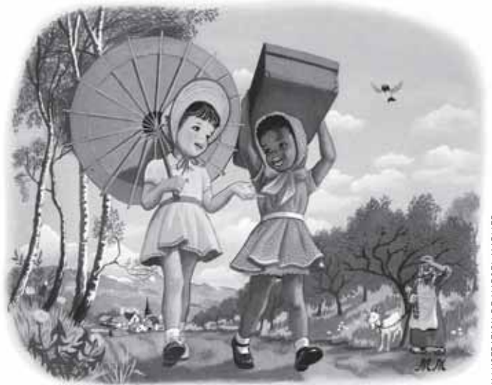
ILLUSTRATION DE MARCEL MARLIER

Lorsque nous nous représentons l'absent, l'étranger et sa culture, ce rapport se complique encore parce que nous ne pouvons le vivre qu'à travers des productions de sens indépendantes de cet autre absent. La plupart d'entre nous n'a pas la possibilité de vivre la culture de l'autre de l'intérieur. Je construis ma représentation de la différence culturelle en nourrissant mon imaginaire de définitions qui sont souvent produites et diffusées par et pour ma propre culture. Je rencontre l'autre dans des films, sur Internet, dans des livres, des débats politiques, en vacances ou encore en discutant dans un café, mais rarement en partageant l'environnement de cet autre. Notre pays, composé de trois régions linguistiques, exprime bien cette difficulté. Les communautés se mélangent peu et ont un